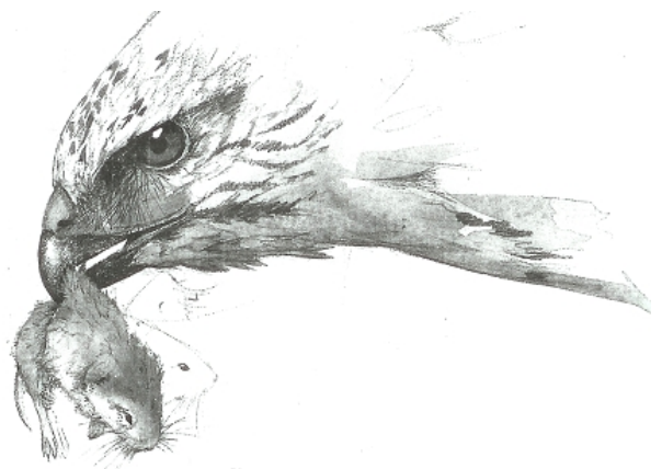
Buizerd met veldmuis, tekening Walty Dudok van Heel

Het aantal paren van de Havik was dit jaar gelijk aan dat van de Sperwer , wie had dat gedacht van die eens zo schuwe bosvogel !